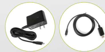
充电器 (5V/1A) 写频线 串口转USB