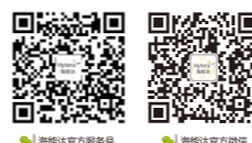
海能达官方服务号 海能达官方微博