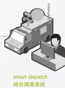
smart dispatch 综合调度系统